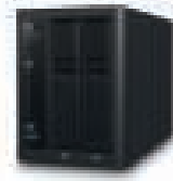
MY CLOUD™ PRO PR2100