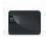
MY PASSPORT™ X