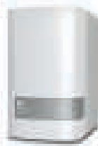
MY CLOUD™ MIRROR