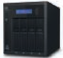
MY CLOUD™ PRO PR4100