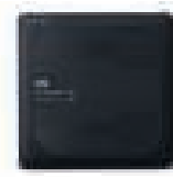
MY PASSPORT™ WIRELESS PRO