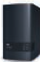
MY CLOUD™ EX2 ULTRA