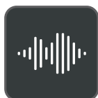
Optima Audio Experience