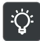
Persoonlijk in te stellen bezig-lampje