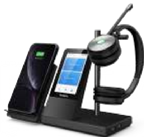
WH66 Mono/Dual: Teams WH66 Mono/Dual: UC