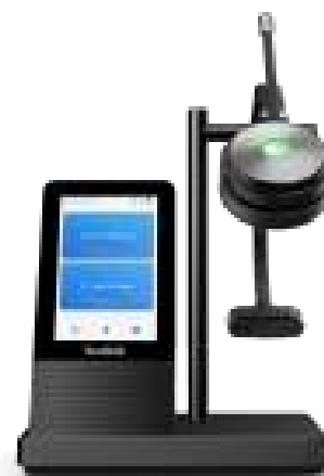
WH66 met oplader *Draadloze oplader is optioneel

In de WH66 is het bezig-lampje ingeschakeld. Als het lampje op de headset of BLT60 op het bureau rood gaat branden, weten omstanders dat u in gesprek bent en zullen ze u niet onbedoeld storen. Zo houdt u uw aandacht bij het gesprek, wat de communicatie efficiënter en de samenwerking beter maakt.