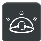
Acoustic Shield Technology

De Yealink WH66 is met de twee modellen WH66 Dual en WH66 Mono dé draadloze DECT-headset binnen de huidige markt die een geheel nieuwe vorm van samenwerking via desktop mogelijk maakt. Werkt naadloos samen met de gangbare UC-platforms en biedt standaardintegratie met Yealink IP-telefoons. Het capacitieve touchscreen van 4,0 inch (480 x 800 pixels) op het basisstation biedt u een vernieuwde werkwijze waarbij u de volledige controle hebt via simpele aanrakingen. Alsof u zelf een telefooncentrale bent, handelt u telefoongesprekken af, maakt u verbinding met verschillende apparaten (bureautelefoon/mobiele telefoon/computer), laadt u uw mobiele telefoon draadloos op en neemt u zelfs de taak van de speakertelefoon over. En om dit multifunctionele werkstation in werking te stellen, hoeft u deze alleen maar in het stopcontact te steken. Zo eenvoudig is het om uzelf van alle gemakken te voorzien.