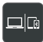
Verbinding met meerdere apparaten